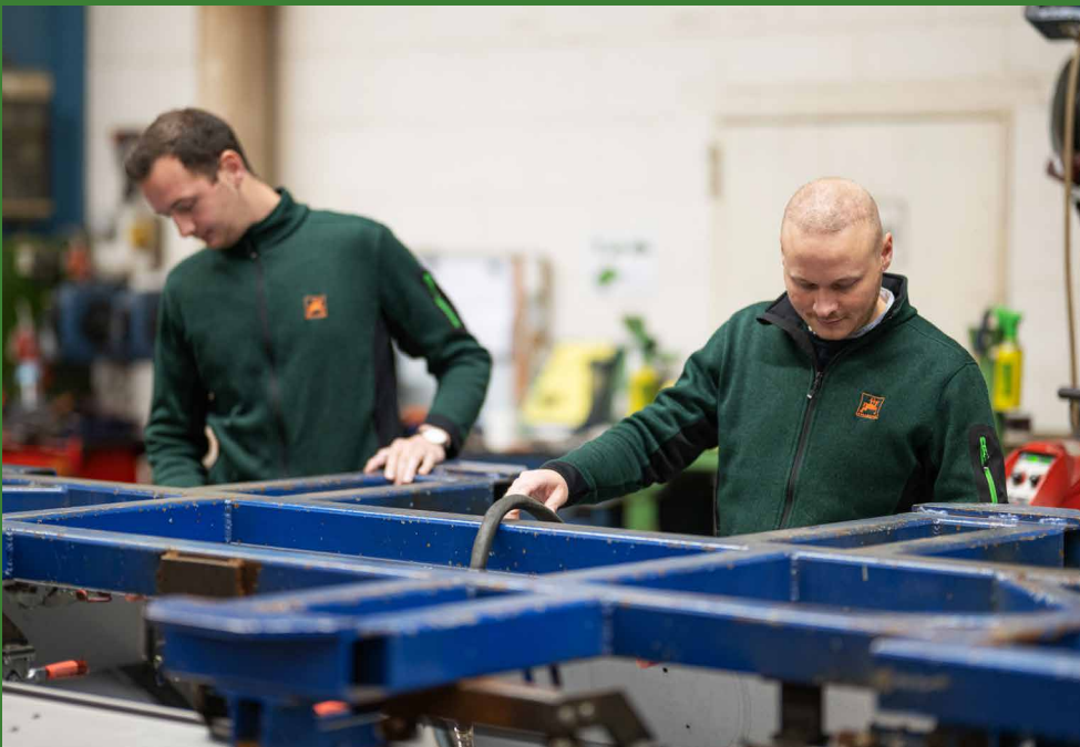
Ingenieure bei der Produktionskontrolle

Ob du aus dem Maschinenbau kommst, den Agrarwissenschaften oder aus den Wirtschaftswissenschaften – AMAZONE bietet die passende Position für dich! Als einer der führenden Landtechnikhersteller bieten wir sowohl im technischen als auch im betriebswirtschaftlichen Bereich vielfältige Einsatzmöglichkeiten.